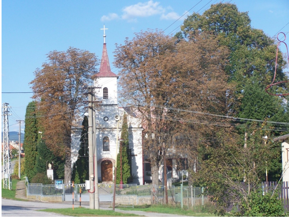
Kostol sv. Juraja vobci