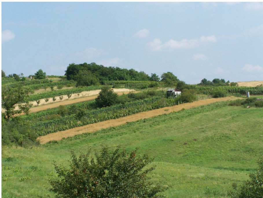
Pohľad na vinohrady súkromných vlastníkov

Na základe analýzy doterajšieho vývoja možno očakávať, že hospodársky život v obci sa bude orientovať na skvalitnenie služieb, ktoré sú poskytované občanom.