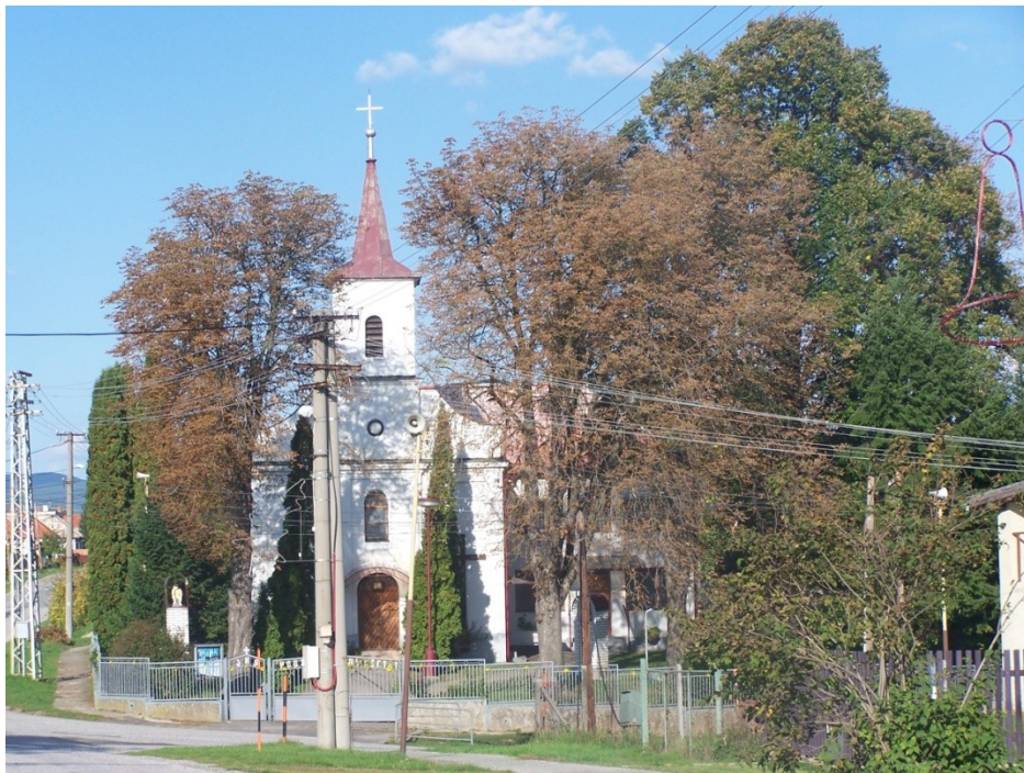
Kostol sv. Juraja vobci